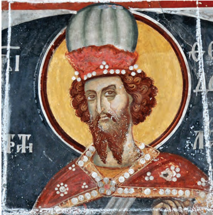
Св. Теодор Стратилат, сликарство во наосот