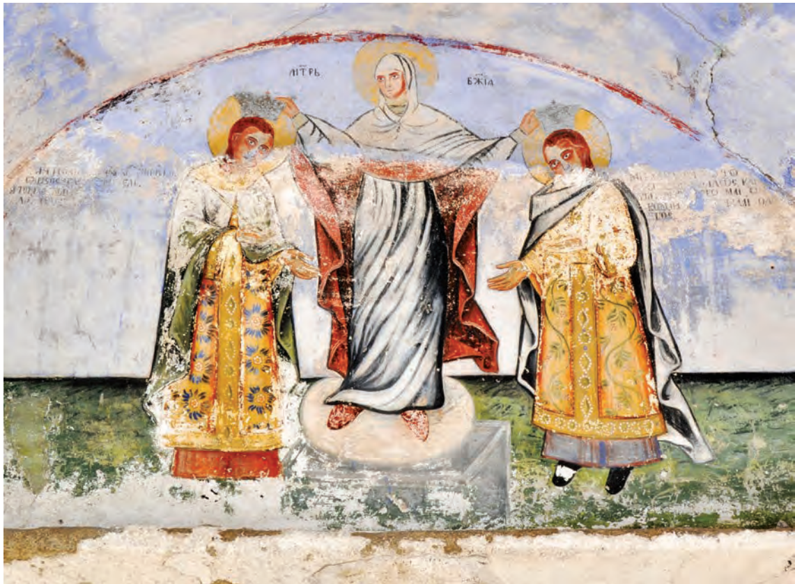
Портрет на Андроник II и Михајло IX, западен влез во манастирот