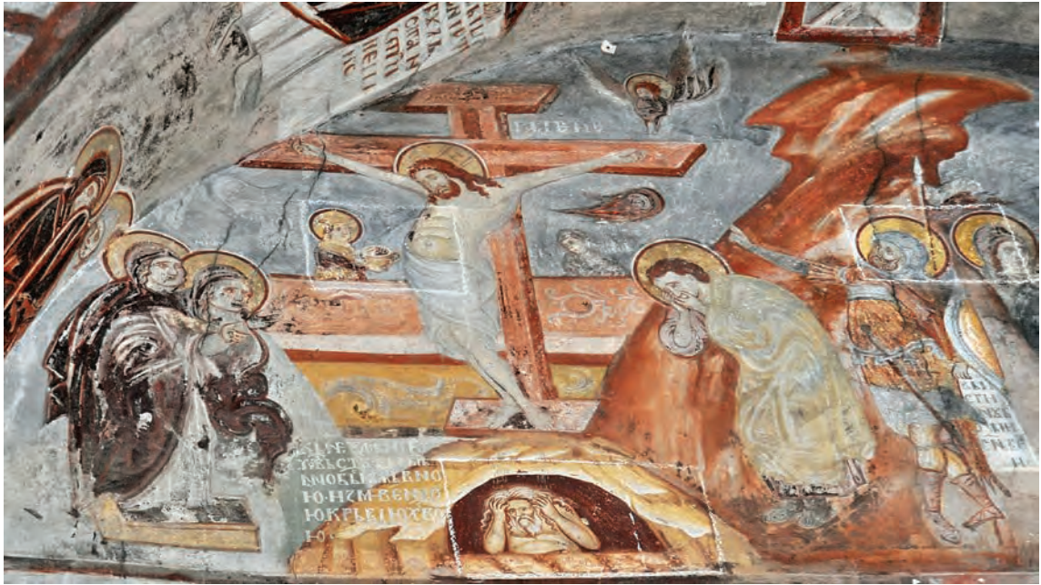
Распятие, сликарство во насот