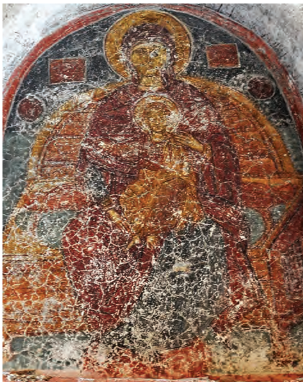
Богородица со Христос, лунета над западниот влез во трpezаријата

која се врти животот во манастирот. Во гранитните карпи во непосредна близина се наоѓа пештерна црквичка која во минатото била испосница, во која се искушувале монасите од манастирот кои копнеее по духовно просветлување. Тие коишто биле дел од трескавечкото општожитие живееле по правилата на манастирскиот типик и поуките и задачите кои им ги определувал игуменот на манастирот. Единството на монашкото братство во верата се градело на литургиите и бдеенјата кои се одржувале во манастирската црква, но и на заедничките оброци во трpezаријата. Обрците се одвивале со молитвена скромност, во атмосфера на религиски обред на камените трпези кои се единствени од овој тип во Македонија. Од сликаната програма на трpezаријата денес е зачуван живописот во апсидата во која била претставена Богородица со Христос придружена од ангелските сили и Причестувањето на апостолиите во пониската зона. Првобитниот живопис во