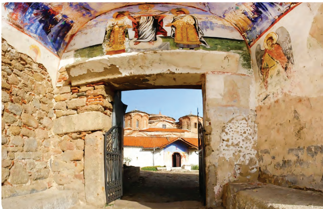
Западната порта од манастирот Трескавец