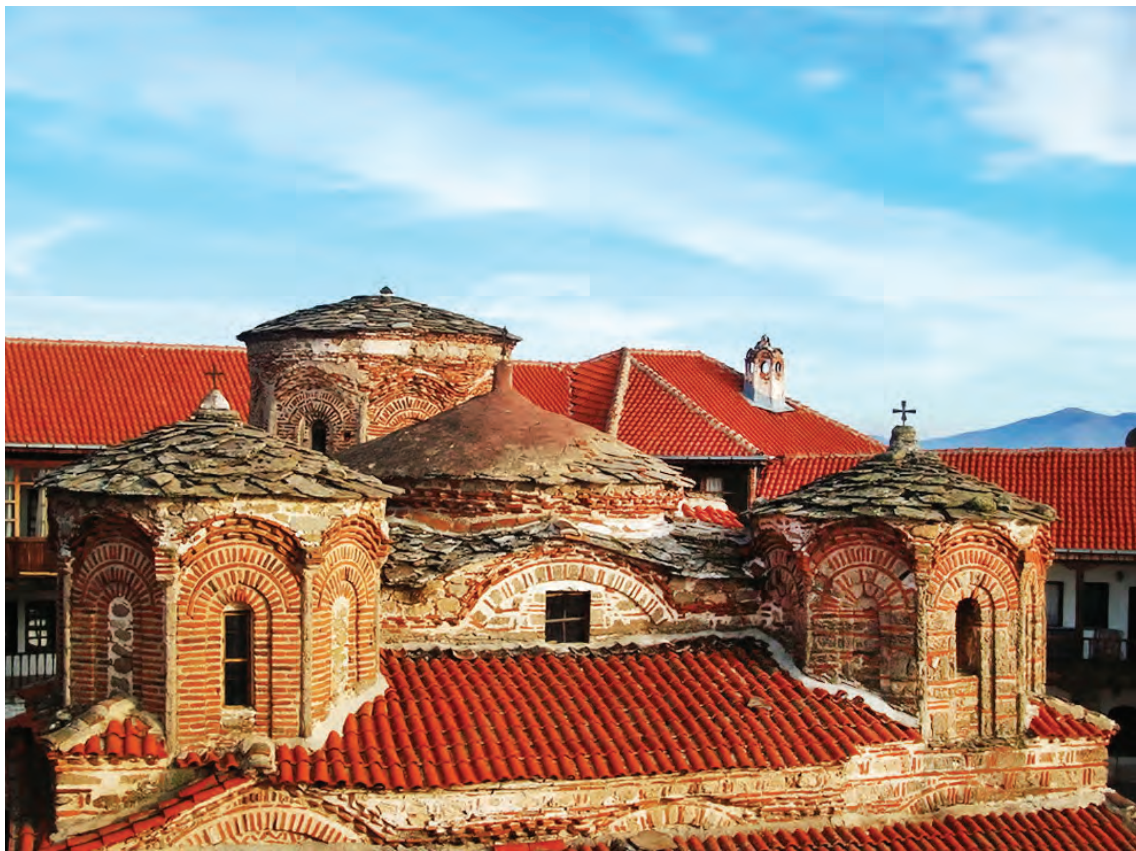
Црквата Успение на Богородица, куполите на егзонартексот