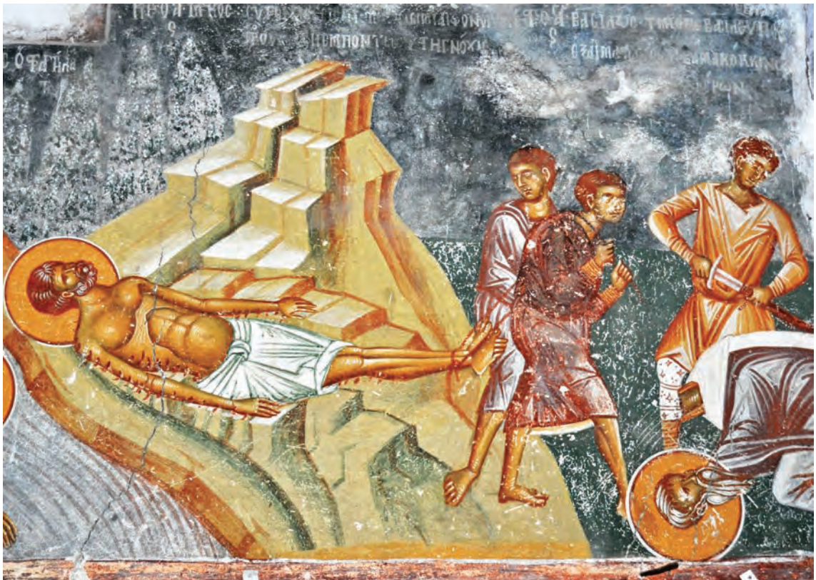
Смртта на св. Марко и св. Василиј Амасиски, менолог