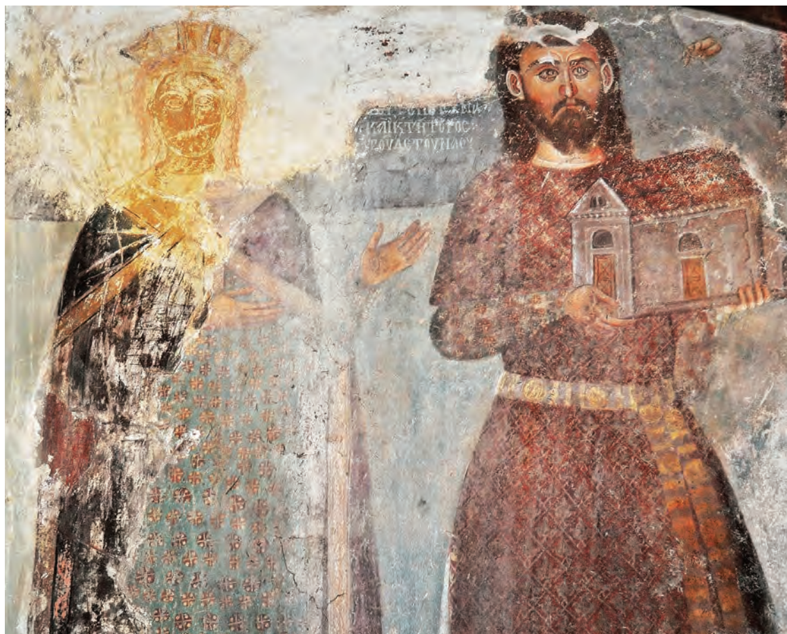
Ктиторскиот портрет на тепчијата Градилав

Во наредните децении од столетието, кога манастирот бил во зенитот од својата моќ, продолжила градежната и сликарската активност во манастирската црква. Во педесеттите години била изградена и живописана капелата на тепчијата Градилав, од која денес постои само западниот ѕид на кој е претставен ктиторскиот портрет. Тепчијата, кој бил една од најзначајни политички фигури на своето време, претставен е како го принесува моделот на неговата задужбина на Христовата претстава од лунетата над вратата, додека од сегмент небо го благословува божјата рака. Облечен е во темноцрвена туника проткаена со сребрен конец со кој е изведен декоративниот мотив од лист врамен во мрежа од ромбови, на половината носи долг ремен, декориран со златни апликации. На широкото лице со костенлива брада, врамено со долгата коса која му паѓа на рамениците, силниот врат и крупното тело на Градилав, се гледаат остатоците од борбената упорност и физичката сила на душановата воена аристократија, која во годините по големите освојувања од средината на векот ги презела