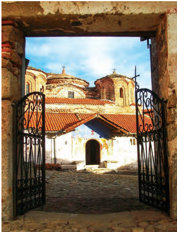
Западниот влез во манастирот

и физички да го поткрепат патникот до крајната дестинација. Напорниот пат на патникот му дава катарзично чувство при пристигнувањето на крајната дестинација, додека непристапноста му го обезбедила спокојството и вонвременоста на манастирот. Векови наназад секоја година на 28 август - празникот на Успението на Богородица - реки од луѓе го врват овој пат за да ја прослават манастирската слава. Тие на кратко ја нарушуваат тишината во која манастирот го продолжува своето многувековно постоење..