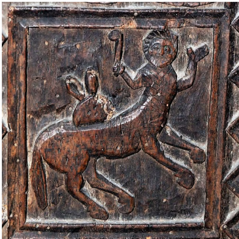
Кентаур, деталъ од резбаните двери

го претставува човечката глава излиена од бронза. Горниот дел од вратата е декориран со полињата завршени со прекршен лак во кои се претставени Богородица и Јован Крстител, архангелите Гаврил и Михаил, апостоли, архијереи и ѓакони. Во долните три реда на секое крило од вратата има по три квадратни рамки, во секоја стои по едно животно. Во долните полиња на трескавечките двери можеме да видиме фантастични и реални животни. Од фантастичните тука се претставени ламји, грифони, кентаури и други химерични суштества, кои биле плод