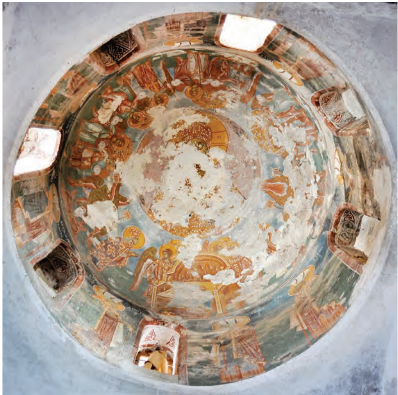
Небесен двор, северозападна купола

Во северозападната купола, над сцените кои го означуваат месецот август, првпат во средновековната уметност е насликана сцената која поради својата сложена теолошка основа во науката е различно толкувана и именувана, но најчесто се нарекува Небесен двор. Идејата за претставувањето на оваа тема ќе биде прифатена и експлоатирана во многу храмови во следните векови, па дури и во насот на истава црква во XV столетие повторно ќе бидат насликани светите војни како властелини во првата зона. Сепак, претставата на Небесниот двор од трескавечкиот егзонартекс со својата местоположба, просторна концепција и комплицирана есхатолошка содржина останала уникатен пример во ортодоксната