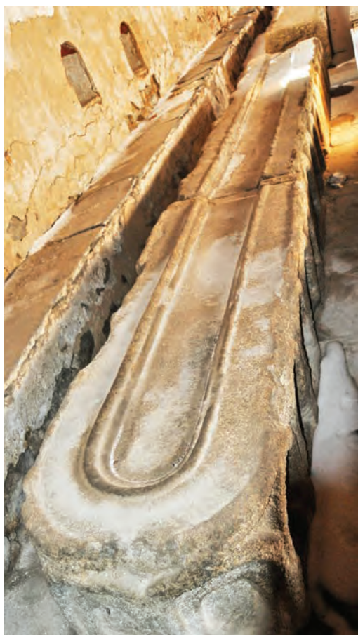
Трpezарија, камени трпези

трpezаријата е создаден во XVII, а во XIX век врз постарото сликарство повторно биле пресликани истите сцени. На живописот кој настанал во XVII столетие му припаѓа и претставата на Богородица со Христос, која се наоѓа во лунетата над западниот влез во трpezаријата.