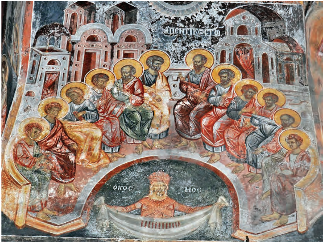
Симнување на Светиот Дух, сликарство во олтарот