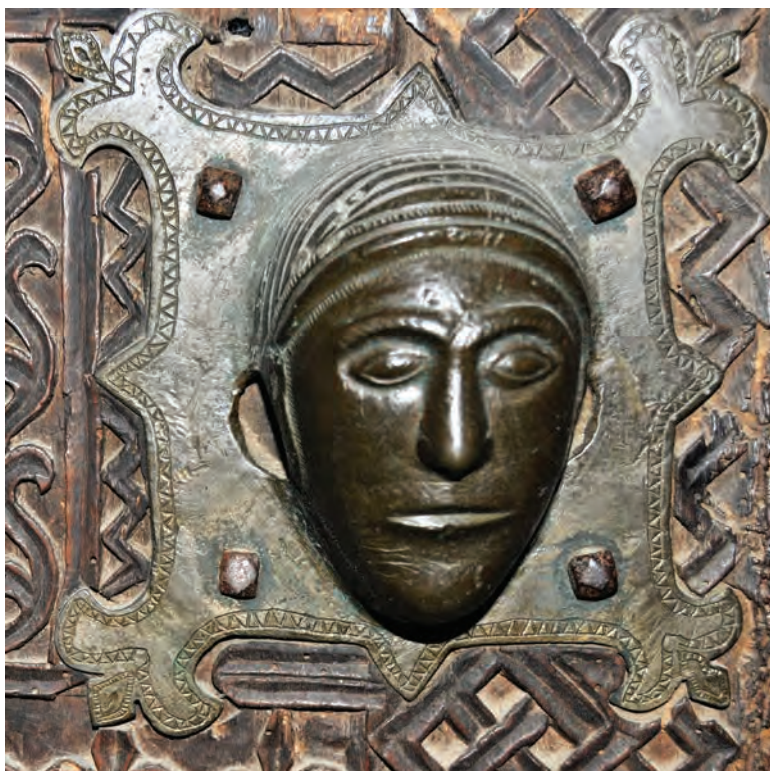
Деталъ од резбаните двери

погледот, се сместени фигури на ангели, светители, луѓе и животни - вистински и фантастични. Водеки сметка за таинственото значење на бројките, тој во седум реда поставил по три претстави, освен на средниот ред каде што стојат две полиња, и на тој начин е остварена бројката од дваесет полиња на секое крило, односно четириесет на целата врата, број што содржи богата библиска симболика. Средниот ред ја дели вратата на две поливини, а во него е претставен по еден свирач и едно змијовидно суштество на секое крило, третиот мотив