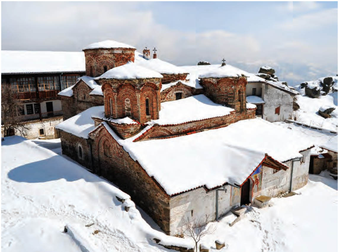
Црквата Успение на Богородица, поглед кон северозапад

Кога кралот Душан првпат го посетил Трескавец, манастирот врз него не оставил впечаток со ниту со бројноста ниту со монументалноста на градбите кои го сочинувале, туку со правоверниот монашки живот, строгиот типик и пустиножителите кои како место за својот подвиг ги одбрале околните карпи. Со растењето на финансиската моќ, духовниот авторитет и бројноста на трескавечкото братство, се надоградувале старите и никнувале нови згради во манастирскиот комплекс. Во времињата кога бил на врвот од својата духовна слава и феудална моќ, манастирот бил утврден со систем од кули и моќни бедеми кои совршено ја користеле стратегиската позиција на местото и непристапноста на теренот за да го бранат од разјарените непријателски орди. Со многубројните природни катастрофи и војските кои минале низ овие простори исчезнале и кулите и ѕидините, а манастирот го добил денешниот изглед со затвореното двориште кое од три страни е ограничено од манастирските конаци, а од јужната со маѓерницата и трпезаријата. Централниот дел на манастирскиот круг го зазема католикониот посветен на Успението на Пресвета Богородица, кој бил и сè уште е главната оска околу