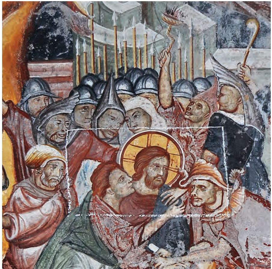
Предавството на Јуда, детаљ, сликарство во насот