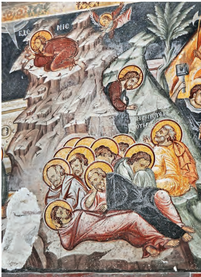
Молитва во Маслиновата гора, сликарство во наосот