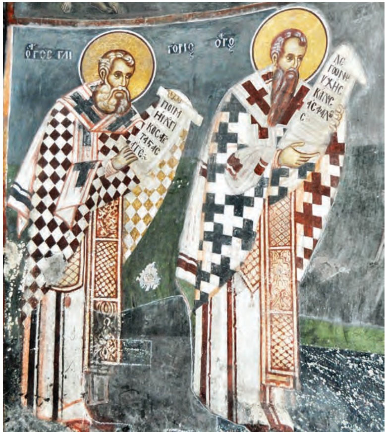
Св. Василиј и св. Григориј, централна апсида, сликарство во олтарот

програмата на живописот, по својата содржина се поврзани со најзначајните догми на првославитето, додека светителските ликови реалистично третирали, полни со животна енергија и емоции се во расчекор со првославната догма и естетика. Ова не се сликите на идеализирани светци, кои не се дел од овој свет туку припаѓаат на друга реалност. Ова се луѓе од крв и месо, полни со животни сили, нивната убавина е симбол на нивната добрина и обратно, оние што се Христови непријатели се со изобличени лица на сурови варвари и со скоро животниски црти на лицата. Овој живопис се поврзува со сликарството на една поголема група споменици кои настанале во последната четвртина на XV век на територијата под јуридикција на Охридската архиепископија - Тесалија, Македонија, Србија и Бугарија, а се смета дека е дело на работилница со центар во Костур. Во ликовниот израз на овие мајстори се препознаваат влијанија од западноевропската уметност, особено од доцноготското сликарство и уметноста на италијанските мајстори од кругот на Ѓото.