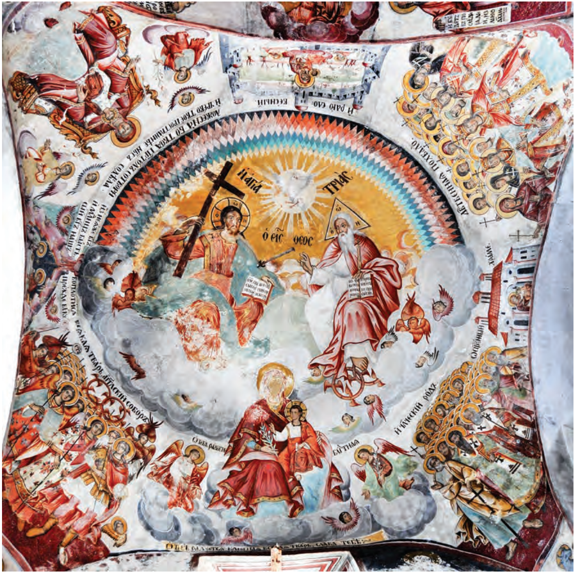
О тебе радуется, внутренняя приправа