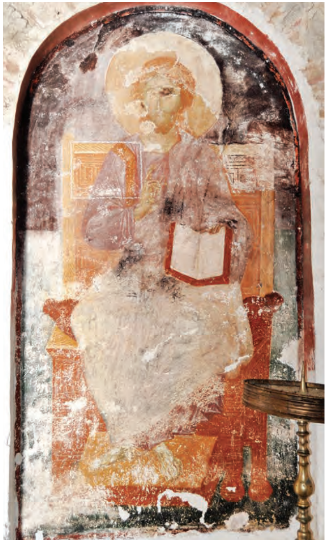
Христос на престол, јужна фасада

бирокарските обврски и се опуштила во летаргичната комоција на цивилизниот живот. До Градислав е насликана и неговата жена во молитвен став, но девастацијата на дел од малтерот го уништила нејзиниот лик, на кој подоцна е направен невешт обид да се ретушира. Ктиторката е облечена во раскошна зелена облека над која носи пурпурен плашт обрабен со лента од златен вез, а на главата има отворена круна украсена со бисери. Според ликовните карактеристики на сочуваниот живопис, мајсторот кој го создал работел во манирот кој е карактеристичен за втората половина на XIV век на територијата на Српското Царство. Индивидуализацијата и психологизирањето на ликот на ктиторот, цврстите и пластично моделирани форми и впечатливиот колорит го одделуваат од фреските во засводените ниши на западната и на јужната фасада, кои биле насликани за кратко време по осликувањето на капелата на Градислав. Фреско-иконите од западната и јужната фасада настанале во седмата деценија на столетието и по своите ликовни квалитети се поврзуваат со сликарството на црквата