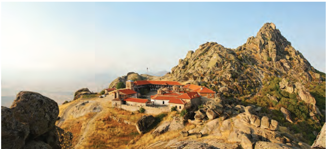
Манастирот Трескавец и Златоврв, поглед од југ