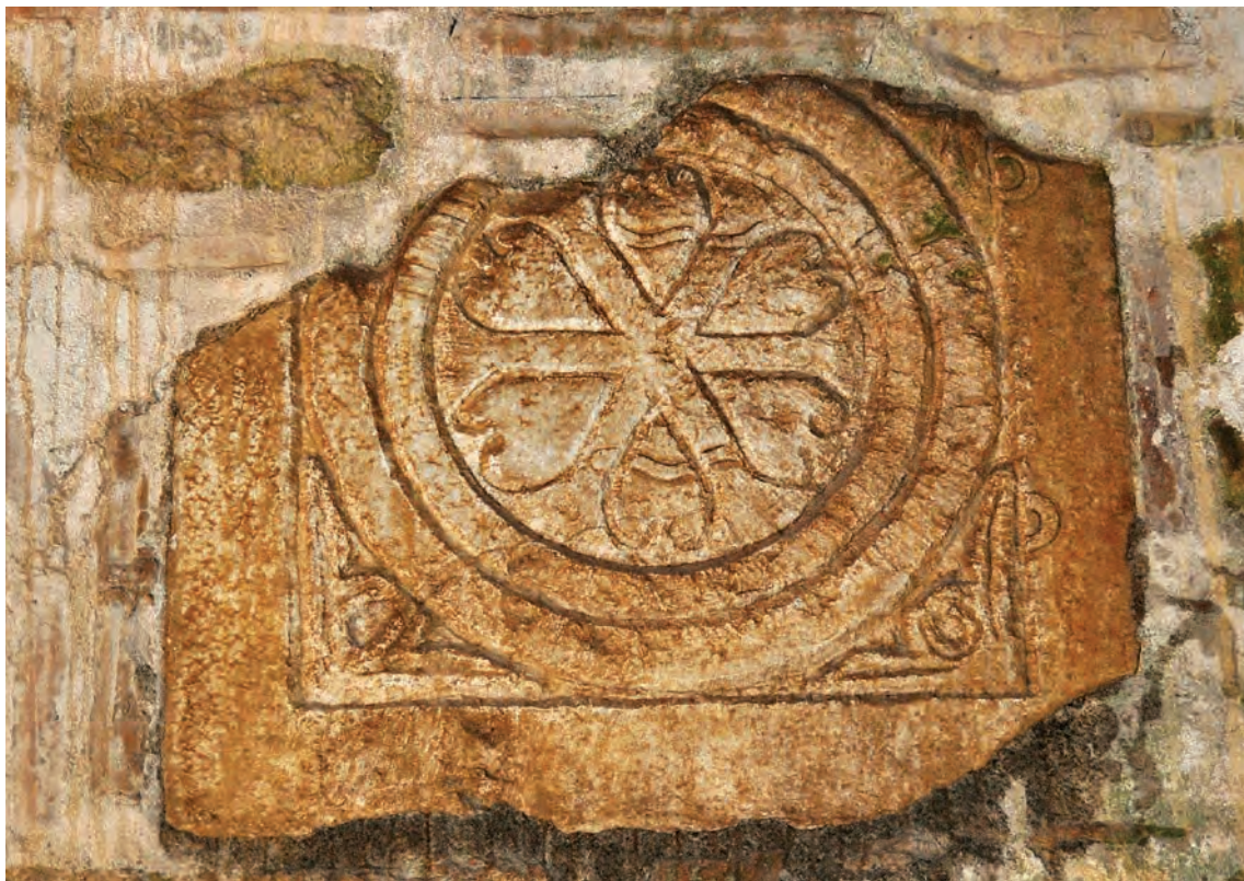
Фрагмент од ранохристијанска камена пластика, западна фасада

Со триумфот на христијанството над останатите религии во Римското Царство, на местата на паганските храмови никнувале христијански цркви, па таков бил случајот и со Трескавец. Деловите од парапетни плочи, кои некогаш биле дел од олтарната преграда на базилика, вградени во фасадата на средновековната црква, упатуваат дека на ова место бил изградена ранохристијанска базилика. Со бурните историски прилики од крајот на VI век населбата веројатно била напуштена, а базиликата оставена сама на себе пропаднала под тежината на вековите. Иако градбата исчезнала, споменот за сакралноста на местото не престанал да живее. Мракот на минатото ги обвил податоците кога повторно заживеало местото со населувањето на монашкото братство и кога бил изграден нуклеусот на денешната црква, но секако дека животот во манастирот неразделно бил поврзан со условите во кои се наоѓала Охридската архиепископија, како и со развитокот на градот Прилеп. Од фрагментарните податоци,