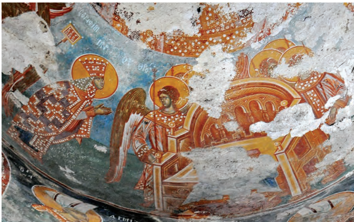
Богородица покрај Пригорвениот престол, Небесен двор, детаљ

уметност. Илустрацијата на Небесниот двор се состои од Христовата биста во темето на куполата, која го претставува центарот на целата сцена. Христос сигниран како Βασιλεύς τῶν Βασιλευόντων – Цар над царевите, на главата носи свечена круна - камелавкион, облечен е во дивидисион и лорос, опточен со златна срма и скапоцени камења. Околу Христовиот лик во две поворки се редат небеските сили сочинети од архангели и ангели, херувими и серафими, власти, тронове господства и моќи. Приоѓајќи кон Приготвениот престол, поворките ги предводат старозаветниот цар Давид, чија претстава е сосема девестирана, и Богородица, облечена во полн царски орант, со висока отворена круна на главата, наметната со пурпурен плашт декориран со крстови извезени со злато и со бисери. Во тамбурот на куполата се насликани фигурите на осум свети војници, претставени како дворјани со раскошни облеку, високи капи на главите и скапоцени жезли во рацете.