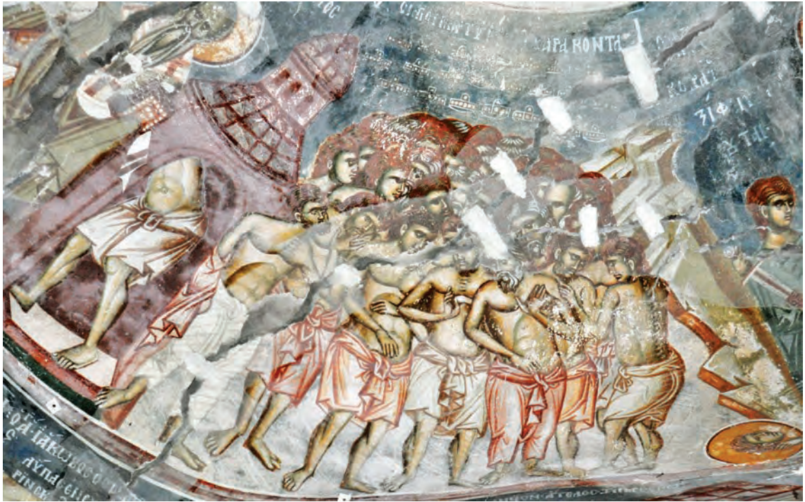
Четириесетте севастиски маченици, менолог