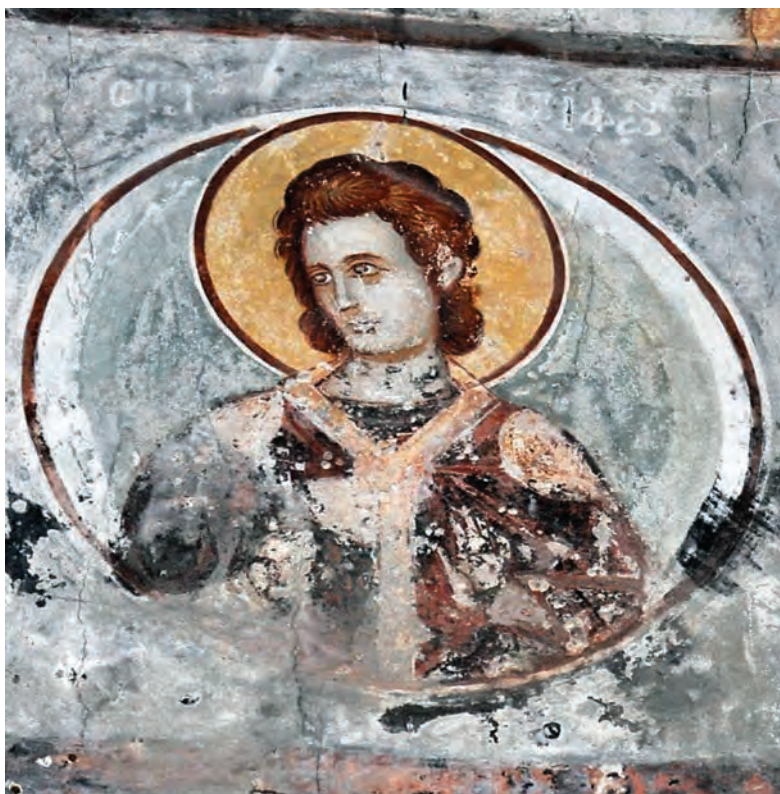
Неидентификуван светител, сликарство во наосот