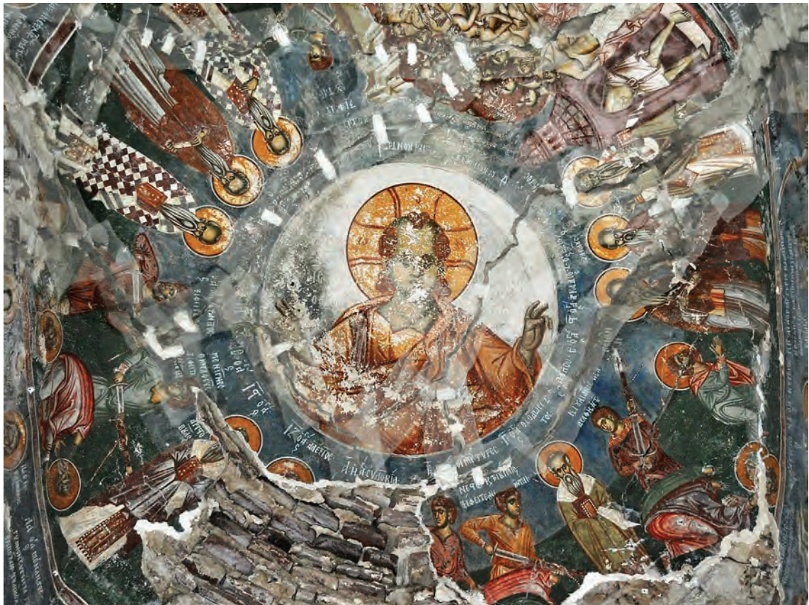
Сликарството во југозападниот дел на егзонартексот

Во тесниот и мрачен простор на надворешната припра на католиконот на Трескавечкиот манастир, посетителот го дочекуваат строгите и достоинствени ликови на светителите од