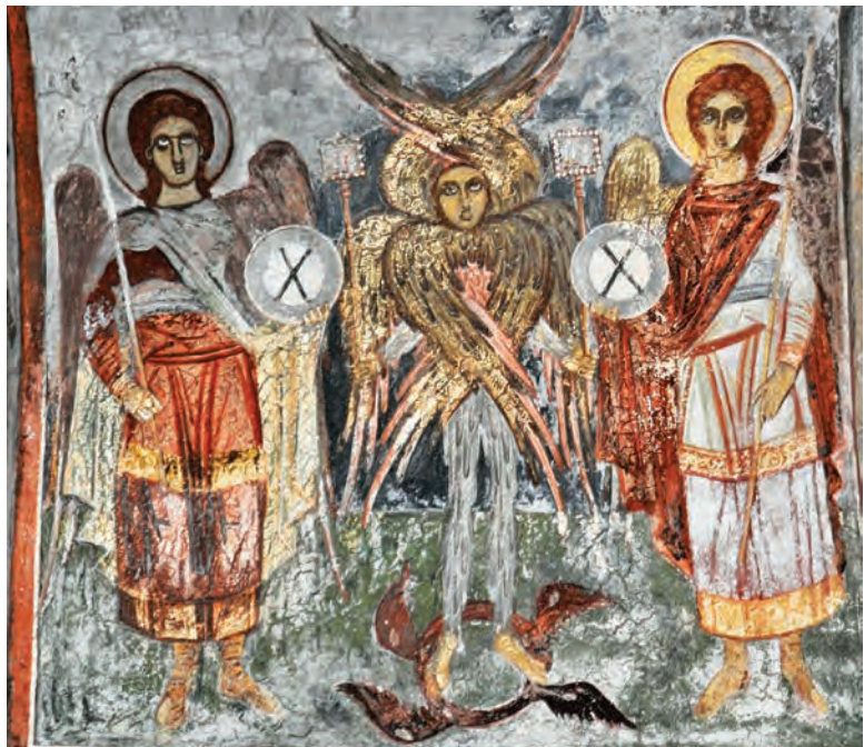
Ангелски сили, сликарство во олтарот