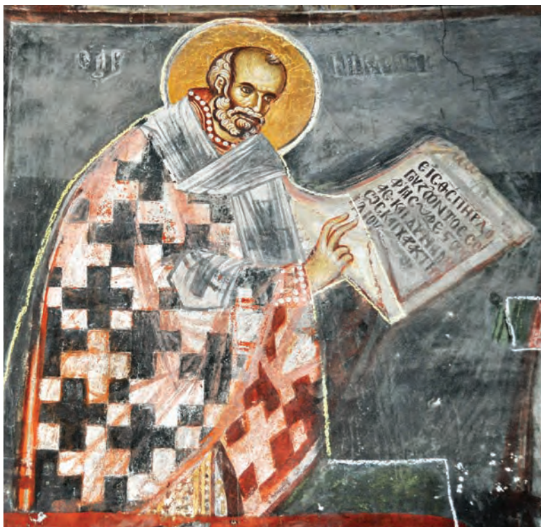
Св. Никола, сликарство во олтарот

Христос е прикажан како световен владетел и како духовен поглавар. На раскошниот трон на кој седи Христос, од едната страна му приоѓа Богородица во царска облека, со отворен свиток во рацете, а од другата Јован Крстител. Фрескоживописот со кој во деведесеттите години од XV столетие биле покриени ѕидовите на Богородичната црква на манастирот Трескавец, се одликува со исклучителна теолошка основа, во чие вообличување покрај библиските се користеле литургиски и апокрифни текстови. Византиското наследство во оваа уметност го гледаме во композициското структурирање и користењето на старите иконографски матрици, но третманот на светителските ликови и облеката, гестикулациите, емотивноста и внесувањето на невообичаени епизоди и елементи во рамките на востановените стандарди упатуваат на западно-европските влијанија врз мајсторите. Главните протагонисти од евангелските случувања вешто се одделени од останатите учесници, а со вклучувањето на епизоди се добива повеќе значност на сцената. Теолошките идеи, кои вешто се вткаени во